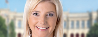
Ulrike Scharf, MdL Staatsministerin für Umwelt und Verbraucherschutz