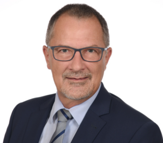
Ihr Jürgen Zinnert Erster Bürgermeister

Information: Aufgrund der aktuellen Corona-Lage und zu Ihrem Schutz finden keine „Haustürbesuche“ oder Präsenzveranstaltungen statt.