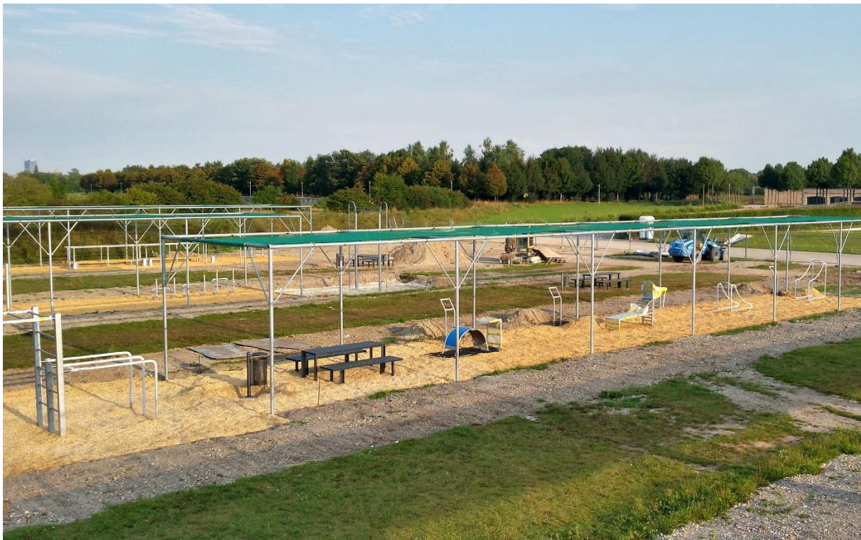
Anlage im Riemer Park, im Bau