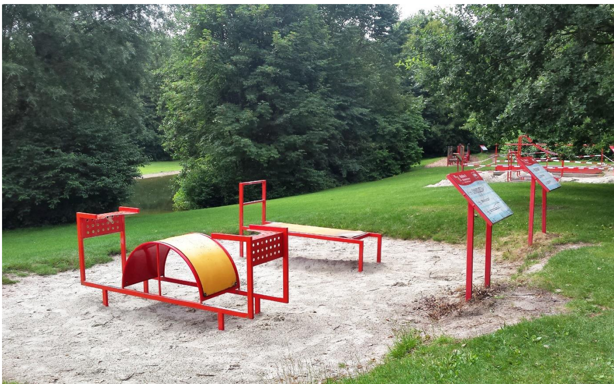
Anlage im Ostpark, eröffnet 2008