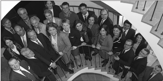
Rechtsabteilung HAUS + GRUND MÜNCHEN

Haus- und Grundbesitzerverein München und Umgebung e.V.