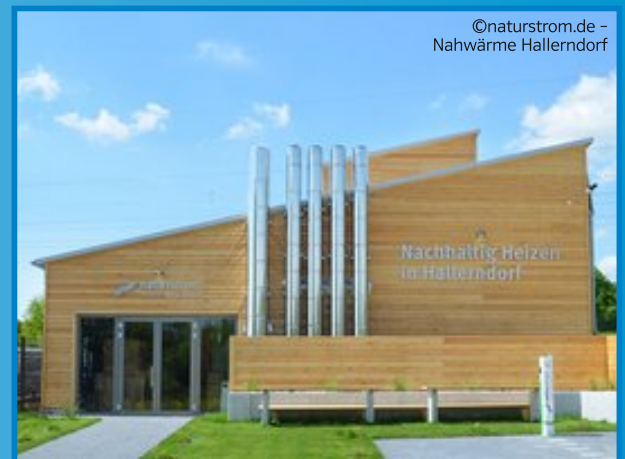
Nahwärme Halleldorf