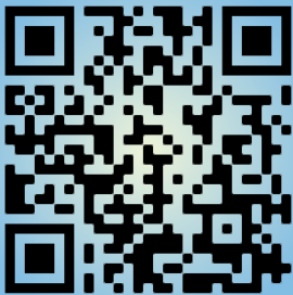
Informationsvideo zur Nahwärme

Viele Haushalte stehen aktuell vor der Entscheidung eine neue Heizung einzubauen. Hierbei stellt sich immer die Frage mit welcher Energie (Heizöl, Pellets, Gas....) diese künftig betrieben werden soll. Eine mögliche Lösung wäre ein Nahwärmenetz für den gesamten Ort. Eine eigene Heizung und die entsprechenden Räume würden dadurch überflüssig.