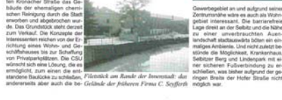
Photostrecke am Ranker der Innenstadt: der ehemalige Jägerhaus-Firma C. Seyffert

Viel Geld wurde in Naila in den 80er Jahren in die Altstadt investiert. Doch mit dem Ausbruch des Immobilienmarktes sind viele Häuser leer stehen geblieben. Die Sanierung dieser Häuser ist ein großes Thema. Die CSU hat sich für die Sanierung dieser Gebäude interessiert. Ein Beispiel ist das ehemalige Bettenhaus Rank am Anger 4. Hier soll ein neues Wohnhaus entstehen. Die Sanierung dieses Gebäudes ist ein wichtiges Thema für die Stadt. Die CSU hat sich für die Sanierung dieses Gebäudes interessiert. Ein Beispiel ist das ehemalige Bettenhaus Rank am Anger 4. Hier soll ein neues Wohnhaus entstehen. Die Sanierung dieses Gebäudes ist ein wichtiges Thema für die Stadt. Die CSU hat sich für die Sanierung dieses Gebäudes interessiert.