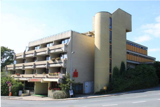
Wurde mit verkauft: das Anna-Berner-Altenwohnheim in Froschgrün.