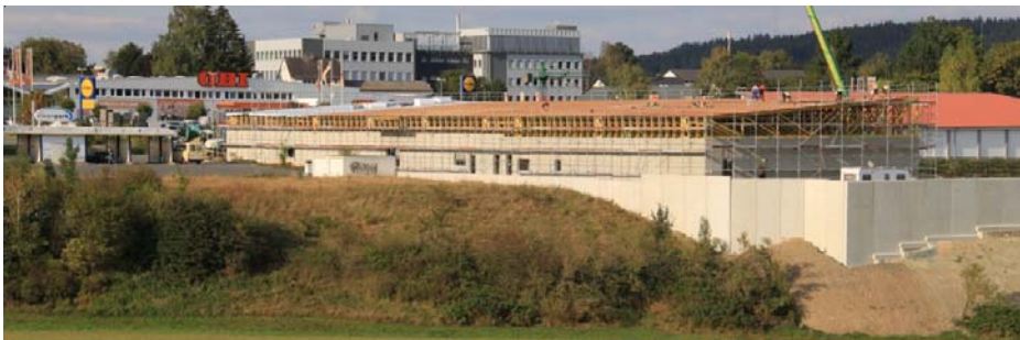
Soll noch in diesem Jahr eröffnen: das ‚Fachmarktzentrum‘ an der Kronacher Straße.

drei Läden für Schuhe, Bekleidung und Drogerieartikel. Sechs Märkte werden also an der Kronacher Straße bald auf tausenden von Quadratmetern mit einem breiten Sortiment dem Einzelhandel in der Innenstadt Konkurrenz machen, wo mehr und mehr Geschäfte leer stehen.