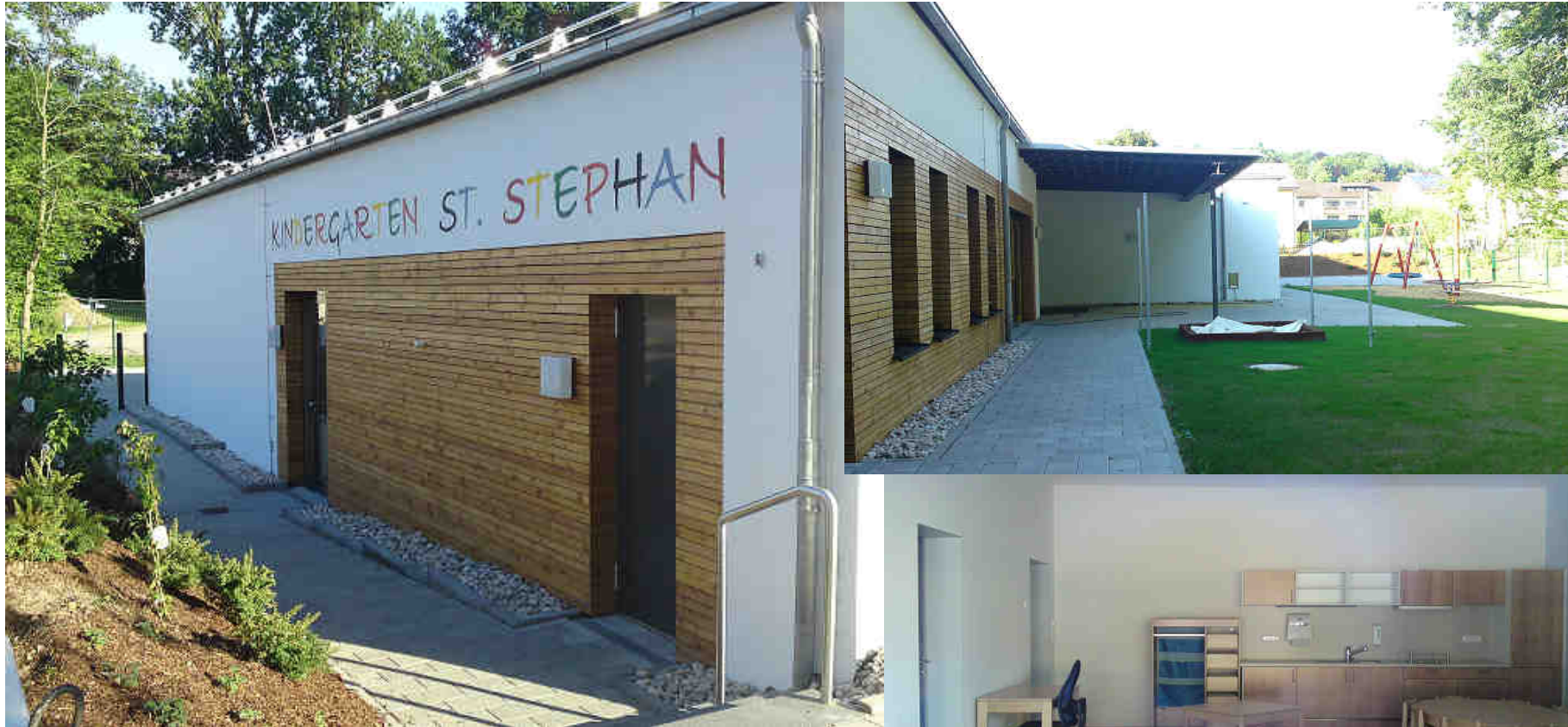
Bilder: Matthias Motta