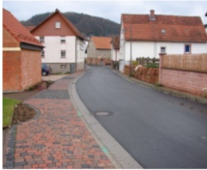
Nach vielen Problemen gelöst: Die neue Ortsdurchfahrt von Edelbach

Trotz hoher Investitionen in Schule, Bildung und Gesundheit wendet der Landkreis auch erhebliche Geldmittel für den Ausbau der Kreisstraßen auf, so im vergangenen Jahr mehr als 7 Mio Euro. Für 2011 stehen über 2 Mio € bereit.