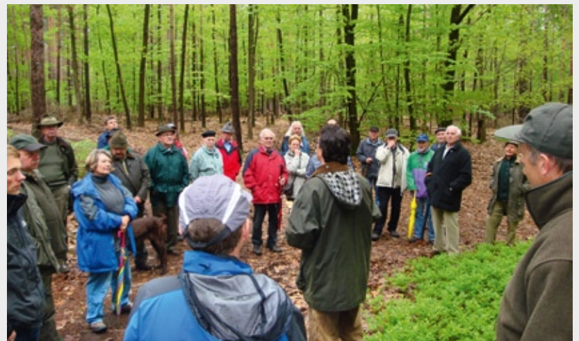
Waldbegehungen mit fachkundigen Informationen sind ein Renner