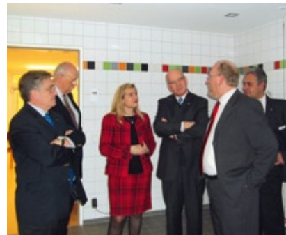
Staatssekretärin Melanie Huml bei ihrem Informationsbesuch im Hospiz Alzenau

richtung eines Hospizes in Alzenau mit 125.000 € aus Haushaltsmitteln des Landkreises Aschaffenburg zu unterstützen. So wurde dann auch beschlossen. Die Stadt Alzenau hatte schon zuvor durch Bereitstellung eines Bauplatzes und einen Zuschuss in Höhe von 125.000 €