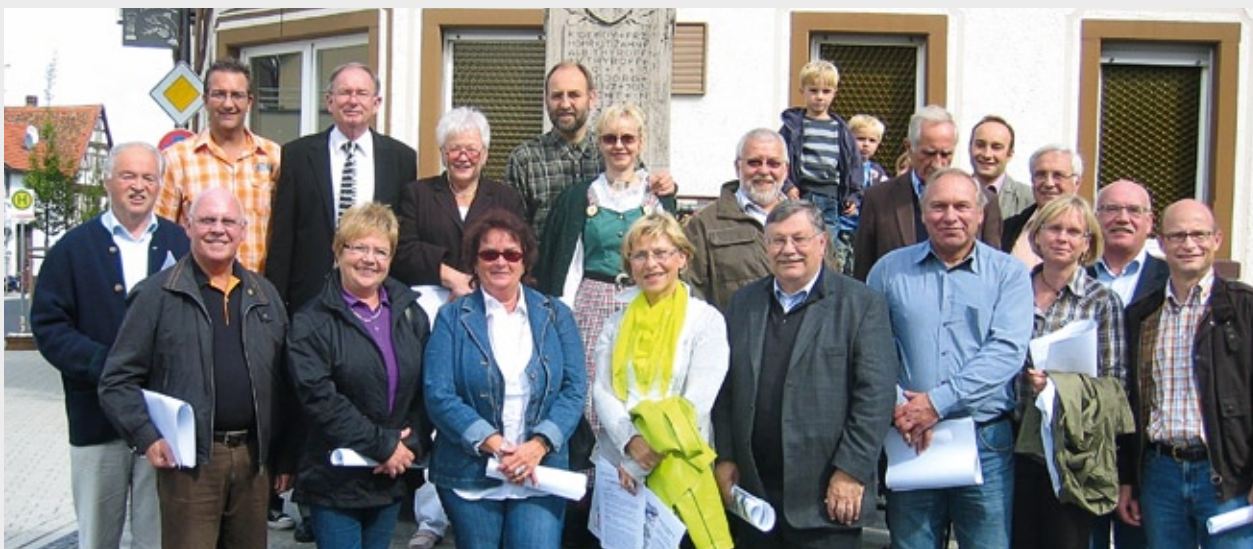
Die CSU-Kreistagsfraktion auf ihrem Kulturtrip in Wenigumstadt