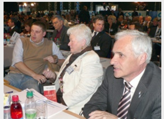
Delegierte aus dem Landkreis Aschaffenburg beim CSU-Parteitag 2010