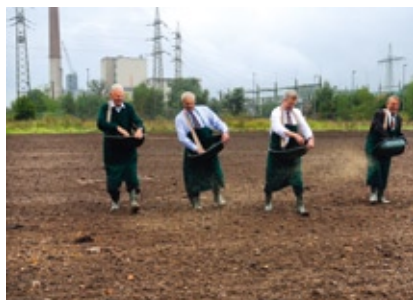
Wo einst das Versuchsatomkraftwerk Kahl stand, entsteht grüne Wiese

Alle Parteien sind sich einig darüber, dass wir nicht von heute auf morgen alle 17 Kernkraftwerke in Deutschland abschalten können. Niemand will, dass es bei uns zu spürbaren Engpässen in der Stromversorgung kommt, die Haushalte durch hohe Strompreise zu sehr belastet werden und unsere Wirtschaft nicht mehr wettbewerbsfähig genug ist. Millionen von Arbeitsplätzen würden dadurch gefährdet werden. Auch kann niemand ernsthaft wollen, dass wir Atomstrom importieren, um bei uns auf die Schnelle die Kernkraftwerke abstellen zu können.