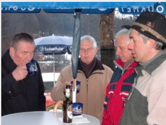
Glühweintreff in Heimbuchenthal, Januar 2011 Schlechtes Wetter kann nicht verdrängen