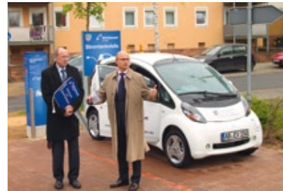
Erfolgreicher CSU-Antrag: Elektroauto und Stromtankstelle am Landratsamt

Im Januar 2009 wurden Vorschläge zur energetischen Sanierung von Schulen und öffentlichen Gebäuden unterbreitet und 2009 und 2010 Beschlussfassungen zum Raumordnungsverfahren Kraftwerk Staudinger empfohlen. Im März 2010 hat