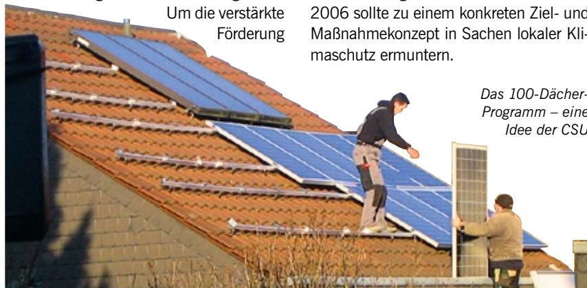
Das 100-Dächer-Programm – eine Idee der CSU

Das Aktionsprogramm „Regionaler/kommunaler Klimaschutz im Landkreis Aschaffenburg“ aus dem November 2006 sollte zu einem konkreten Ziel- und Maßnahmenkonzept in Sachen lokaler Klimaschutz ermuntern.