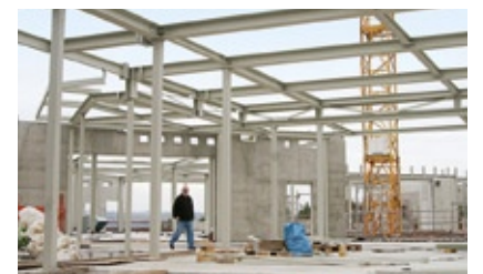
Investitionen in die Gesundheit: Das Klinikum Aschaffenburg

Unsere Gesellschaft steht vor großen Herausforderungen. Vieles können nur wir vor Ort umsetzen, beispielsweise ein gutes gesellschaftliches Miteinander durch Integration und Bildung, einen festen sozialen Zusammenhalt für ein funktionierendes Gesundheitssystem und ein faires Sozialsystem, die nachhaltige