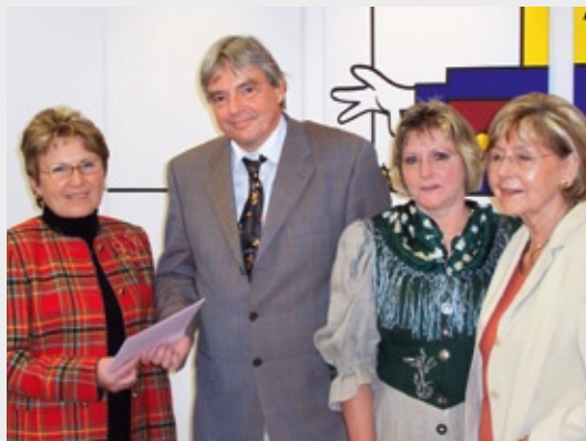
Mit einer Geldspende unterstützt die Frauen-Union Alzenau das Palliativhaus im Klinikum