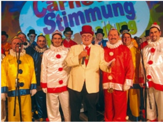
Mit Kultstatus: Die Schwarze Narrensitzung in Wasserlos