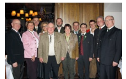
Jahresempfang des Bayerischen Jagdverbandes am 1. Februar 2011