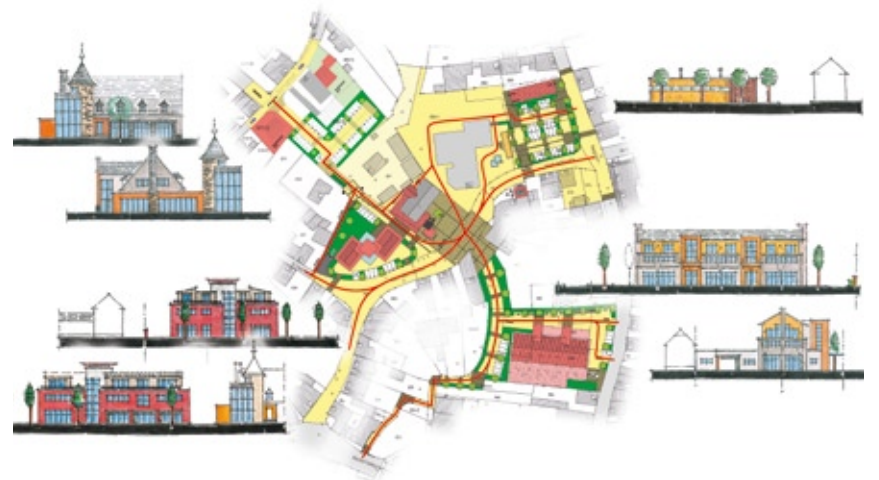
Viele Wege führen auf der Planskizze in ein durch restaurierte und neue Gebäude aufgewertetes Goldbacher Ortszentrum

Die Goldbacher CSU hat für die Neugestaltung des Ortskerns ein umfassendes Konzept ausgearbeitet. Ziel der Überlegungen ist es, ein lebendiges und lebenswertes Zentrum zu schaffen.