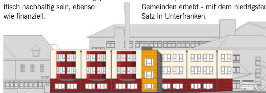
Ansicht der Erweiterung des Kreiskrankenhauses Alzenau-Wasserlos

Die täglichen Aufgaben zu lösen, ist eine ständige Herausforderung jeglicher Politik. Nachhaltige Kommunalpolitik betreiben - so heißt die aktuelle Herausforderung! Nachhaltigkeit hat dabei neben der ökologischen Komponente viele andere wichtige Aspekte. Kommunalpolitik muss heute auch sozial und bildungspolitisch nachhaltig sein, ebenso wie finanziell.