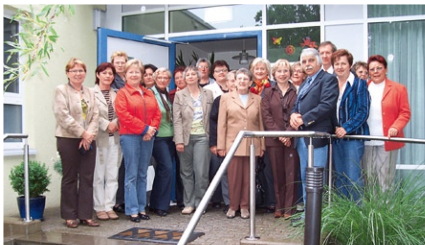
Die Frauen-Union Aschaffenburg-Land informiert sich beim Besuch des Hospizes Louise de Marillac in Hanau

Fragen der Sterbebegleitung intensiver auseinander zu setzen. Dem Antrag der CSU-Kreistagsfraktion vom 17. September 2009, die Möglichkeit auf Errichtung eines Hospizes im Landkreis zu prüfen, ging bereits eine längere Meinungsbil-