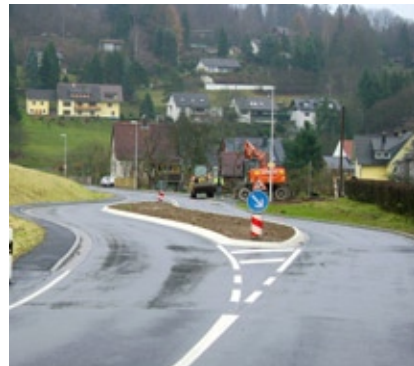
Jetzt mehr Sicherheit: Die geschwindigkeitsreduzierende Verkehrsinsel vor Rothenbuch

Am aufwendigsten in diesem Jahr mit jeweils rund 0,7 Mio sind die Weiterführung der Maßnahme AB 4 mit der Ortsdurchfahrt Waldaschaff und die Ortsdurchfahrt Hofstädten der AB 18.