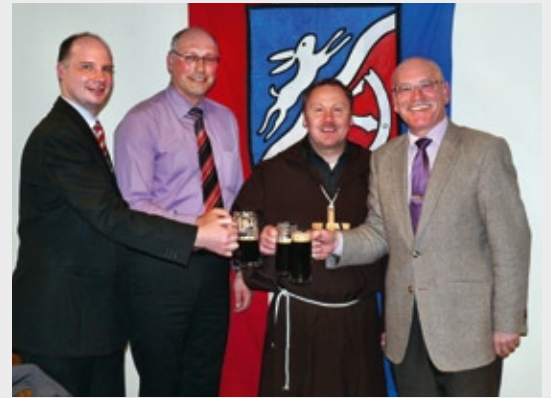
Starkbieranstich 2011 bei der CSU Kahl