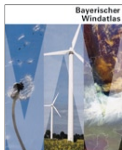
Der Bayerische Windatlas liefert wertvolle Informationen

Einigkeit überall, dass in Deutschland der Atomausstieg nach den katastrophalen Ereignissen in Japan schneller als bisher geplant erreicht werden soll und erneuerbare Energien möglichst bald den ausfallenden Atomstrom ersetzen sollen. So weit, so gut!