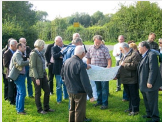
Bei der Kreisstraßen-Bereisung 2010 wurde auch die Planung für die Umgehungsstraße Pflaumheim erörtert