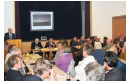
Großes Interesse bei der Diskussion über Windkraft-Anlagen Mitte April 2011

die CSU-Kreistagsfraktion eine Forcierung der Initiative „Pro Nahversorgung“ angeregt, im November 2010 Aktivitäten zur Förderung der Elektromobilität aufgelistet und im Februar 2011 einen Antrag auf Information über die regionale Fluglärm-Belastung eingebracht. Der Antrag, zur Prüfung der Rechtmäßigkeit des Genehmigungsbescheides zur Erweiterung des Kraftwerkes Staudinger die Klage der Stadt Alzenau finanziell zu unterstützen, wurde im Kreisausschuss im März 2011 einstimmig gebilligt.