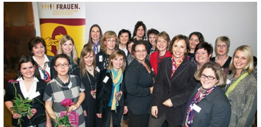
Abschlussveranstaltung der Mentees mit Sozialministerin Christine Haderthauer

Der FU-Bezirksverband hat erneut ein interessantes Rahmenprogramm entwickelt. Es werden zum Beispiel ein Besuch des Landtags, ein Rhetorikseminar, ein Firmenbesuch und der Besuch des Europäischen Parlaments angeboten. Das vollständige Programm kann man dem Flyer auf der Homepage der Landkreis-FU unter www.fu-aschaffenburg.de entnehmen. Die Abschlussveranstaltung wird am 2. März 2012 im Ivo-Zeiger-Haus Mömbris stattfinden. Angesprochen sind Frauen jeden Alters. Sie