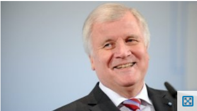
CSU-Vorsitzender, Ministerpräsident Horst Seehofer lädt alle ein, sich in der CSU, der Volkspartei Bayerns, zu engagieren.

Die Kraft zu notwendigen Veränderungen hat eine Partei umso eher, je stärker sie in ihrer Heimat verankert ist. Wir sind Bayerns Volkspartei. Die große Mitgliederzahl der CSU war und ist das Fundament unserer Politik. Sie schafft uns den nötigen Rückhalt in der Bevölkerung. Die CSU-Verbände mit ihrer breiten Verwurzelung an der Basis ermöglichen Politik aus einem Guss und auf allen politischen Ebenen: in den Gemeinden, Landkreisen und Bezirken ebenso wie in den Parlamenten in München, Berlin und Brüssel.