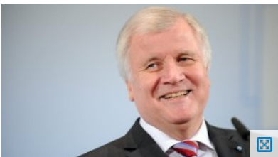
CSU-Vorsitzender, Ministerpräsident Horst Seehofer lädt alle ein, sich in der CSU, der Volkspartei Bayerns, zu engagieren.

Die Kraft zu notwendigen Veränderungen hat eine Partei umso eher, je stärker sie in ihrer Heimat verankert ist. Wir sind Bayerns Volkspartei. Die große Mitgliederzahl der CSU war und ist das Fundament unserer Politik. Sie schafft uns den nötigen Rückhalt in der Bevölkerung. Die CSU-Verbände mit ihrer breiten Verwurzelung an der Basis ermöglichen Politik aus einem Guss und auf allen politischen Ebenen: in den Gemeinden, Landkreisen und Bezirken ebenso wie in den Parlamenten in München, Berlin und Brüssel.