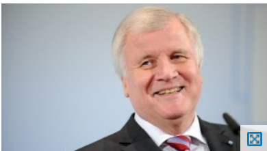
CSU-Vorsitzender, Ministerpräsident Horst Seehofer lädt alle ein, sich in der CSU, der Volkspartei Bayerns, zu engagieren.

Die Kraft zu notwendigen Veränderungen hat eine Partei umso eher, je stärker sie in ihrer Heimat verankert ist. Wir sind Bayerns Volkspartei. Die große Mitgliederzahl der CSU war und ist das Fundament unserer Politik. Sie schafft uns den nötigen Rückhalt in der Bevölkerung. Die CSU-Verbände mit ihrer breiten Verwurzelung an der Basis ermöglichen Politik aus einem Guss und auf allen politischen Ebenen: in den Gemeinden, Landkreisen und Bezirken ebenso wie in den Parlamenten in München, Berlin und Brüssel.