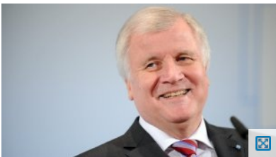
CSU-Vorsitzender, Ministerpräsident Horst Seehofer lädt alle ein, sich in der CSU, der Volkspartei Bayerns, zu engagieren.

Die Kraft zu notwendigen Veränderungen hat eine Partei umso eher, je stärker sie in ihrer Heimat verankert ist. Wir sind Bayerns Volkspartei. Die große Mitgliederzahl der CSU war und ist das Fundament unserer Politik. Sie schafft uns den nötigen Rückhalt in der Bevölkerung. Die CSU-Verbände mit ihrer breiten Verwurzelung an der Basis ermöglichen Politik aus einem Guss und auf allen politischen Ebenen: in den Gemeinden, Landkreisen und Bezirken ebenso wie in den Parlamenten in München, Berlin und Brüssel.