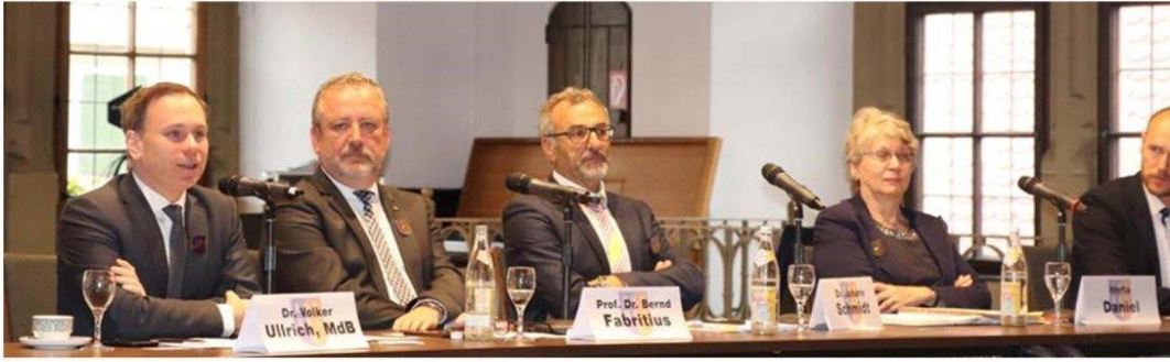
Diskussion zur Rentenpolitik beim Tag der Siebenbürger Sachsen in Dinkelsbühl. Es ist Zeit, Ungerechtigkeiten im Fremdrentenrecht für Spätaussiedler zu beseitigen!