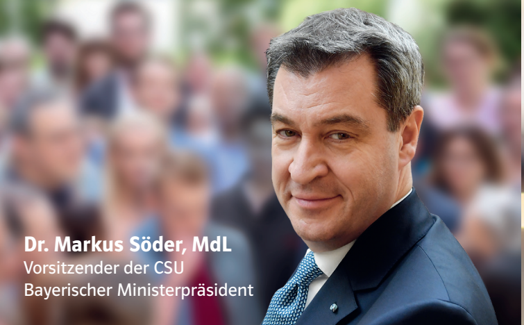
Dr. Markus Söder, MdL Vorsitzender der CSU Bayerischer Ministerpräsident

Sehr geehrte Damen und Herren, die CSU steht fest zu unseren Polizistinnen und Polizisten. Sie leisten hervorragende Arbeit für unser Land. Sie sind unsere Helfer in Not und gewährleisten im täglichen Dienst die Sicherheit der Bevölkerung. Für uns ist klar: Unsere Sicherheits- und Einsatzkräfte verdienen vollen Respekt und unsere Anerkennung!