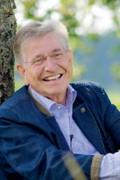
Dr. Thomas Goppel Landesvorsitzender der SEN