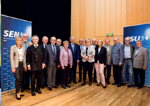
Landesvorstand der Senioren-Union der CSU