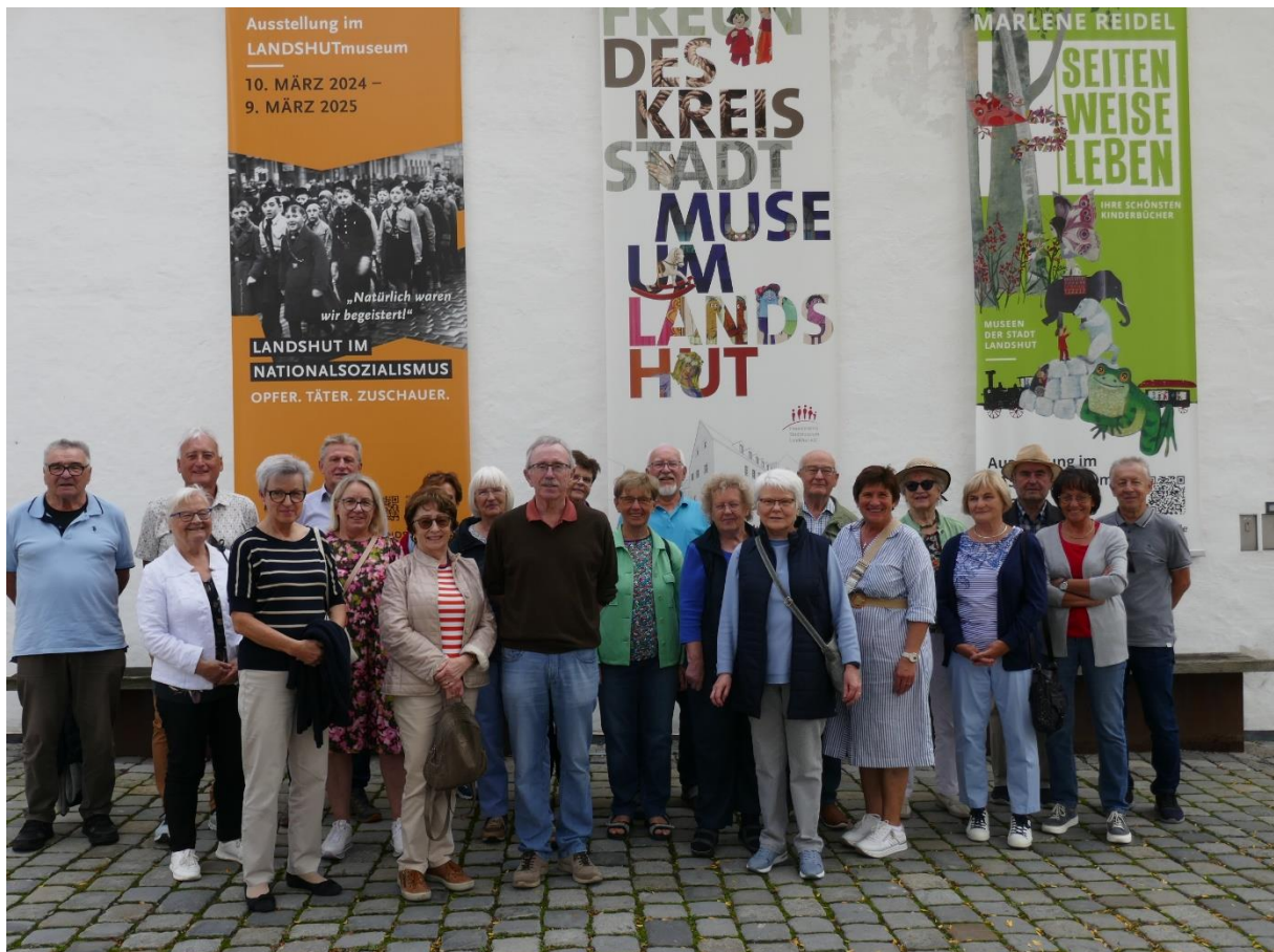
Die Teilnehmer an der Ausstellung.

Bericht und Fotos von Josef Rothenaigner