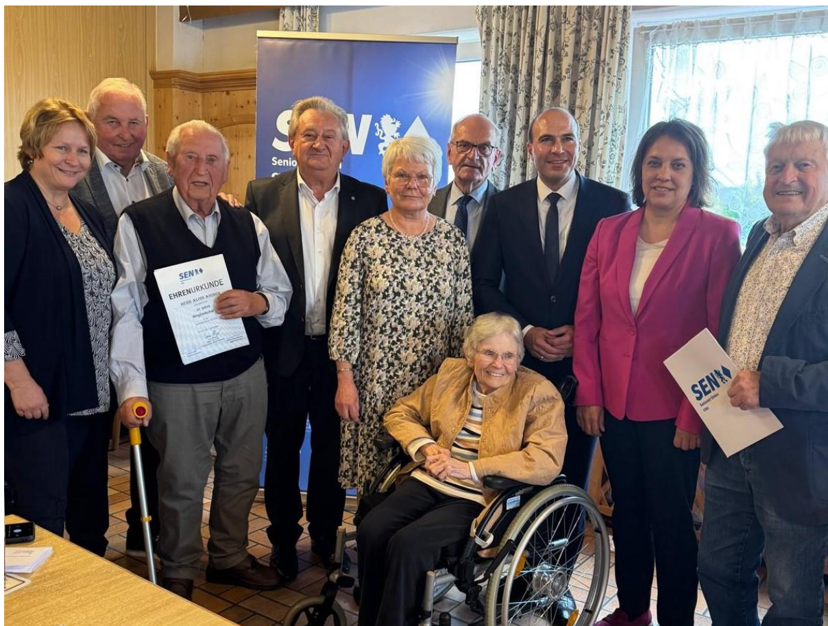
Die Ehrengäste und die geehrten Gründungsmitglieder am Ende der Feierstunde.