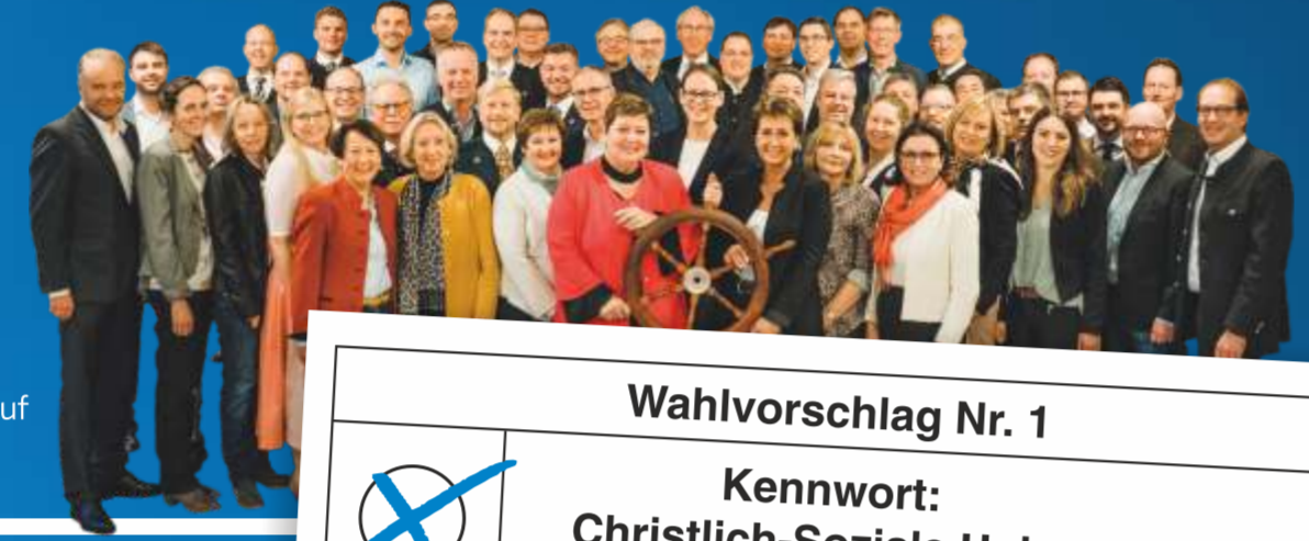
V.i.S.d.P. CSU-Kreisverband Weilheim-Schongau - Alexander Dobrinndt - Sonnenstraße 46 - 82380 Peißenberg Gestaltung und Produktion: Österreich Design & Marketing - Birkenland 40 - 86971 Peiting - Fehler und Änderungen vorbehalten