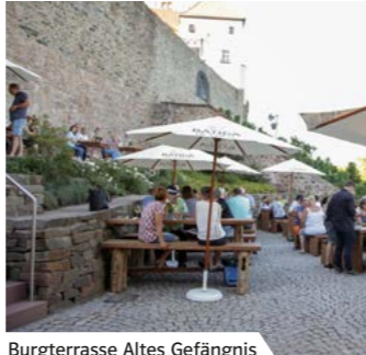
Burgterrasse Altes Gefängnis