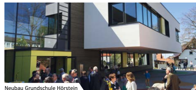
Neubau Grundschule Hörstein