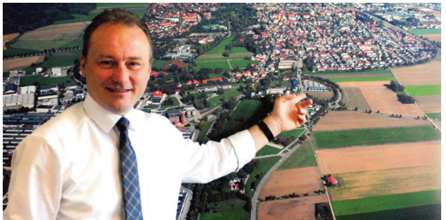
Das Wohl Bobingens und der Stadtteile hat Bürgermeister Klaus Förster immer im Blick.

dierte Datengrundlage benötigt. Deshalb gebt sich die CSU Stadtratsfraktion zusammen mit der CSU Vorstandschaft demnächst in einen Workshop, um wichtige Punkte einer Datenerhebung zu definieren. Diese sollen dann in den Auftrag an das Fachbüro aufgenommen werden. Wer sich hier einbringen will oder uns seine Gedanken mitteilen möchte, kann dies gerne tun und dazu eine Email an info@csu-bobingen.de senden.