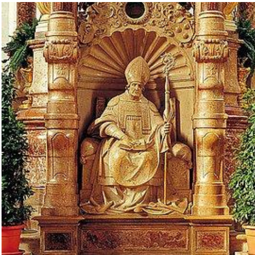
Impressionen von Eichstätt

Nach dem Mittagessen im Gasthof Krone am Domplatz – probieren sie vielleicht das Altmühltaler Lamm - zeigt uns eine Fremdenführerin eine gute Stunde die Sehenswürdigkeiten von Eichstätt. Danach steht die Zeit zur freien Verfügung.