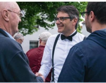
Im Gespräch mit Jung und Alt.

Von Beruf bin ich Diplom-Ingenieur und seit über 23 Jahren bei dem mittelständischen Unternehmen Göhler Anlagen-technik GmbH und Co KG in unserer Region als Projektleiter im Anlagenbau beschäftigt. Als leitender Angestellter übernehme ich Verantwortung für Mitarbeiter und Budget. In meinem Beruf haben Zielstrebigkeit, Ordnungssinn und wirtschaftliches Denken den höchsten Stellenwert. Technische Regeln und das Baurecht gehören zu meinem beruflichen Alltag. Diese Faktoren sowie Führungsstärke, Vertrauen und Ehrlichkeit sind meine persönlichen Stärken, welche ich in das Bürgermeisteramt einbringen kann.