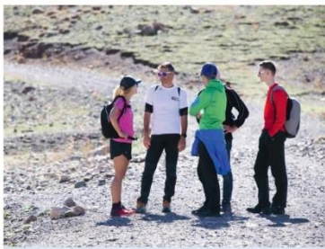
Teamgeist im Sport