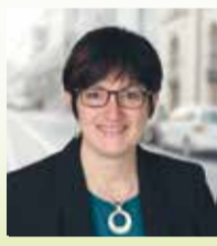
Liste 1 Platz 7 CSU 51 Jahre, verheiratet, 3 Kinder Dipl.-Ing. für Haushalts- und Ernährungstechnik (FH), Großaitingen Kreisbäuerin