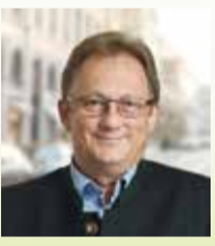
Liste 1 Platz 56 CSU 56 Jahre, verheiratet, 2 Kinder Maschinenbauing. i.R., Großaitingen Kreisvorsitzender Bayerisches Rotes Kreuz