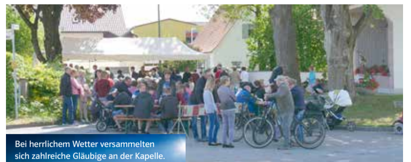
Bei herrlichem Wetter versammelten sich zahlreiche Gläubige an der Kapelle.

mit Dacheindeckung, Pflaster, Gitter sowie die drei Kreuze mit den