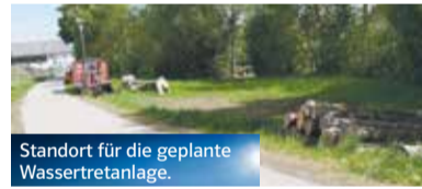
Standort für die geplante Wassertretanlage.

4. Wassertretanlage: Beschlossen wurde der Bau einer Wassertretanlage an der Singold, Ecke Oberer Singoldweg/Bodenseestraße. Die Kosten werden auf ca. 40.000 EUR geschätzt. Die Anlage wird eine Bereicherung für die Bürger sein und einen Beitrag zur Steigerung des Erholungswertes leisten.