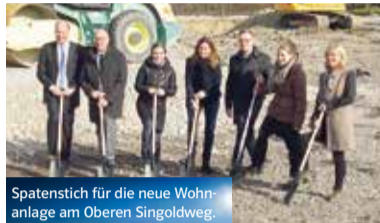
Spatenstich für die neue Wohnanlage am Oberen Singoldweg.