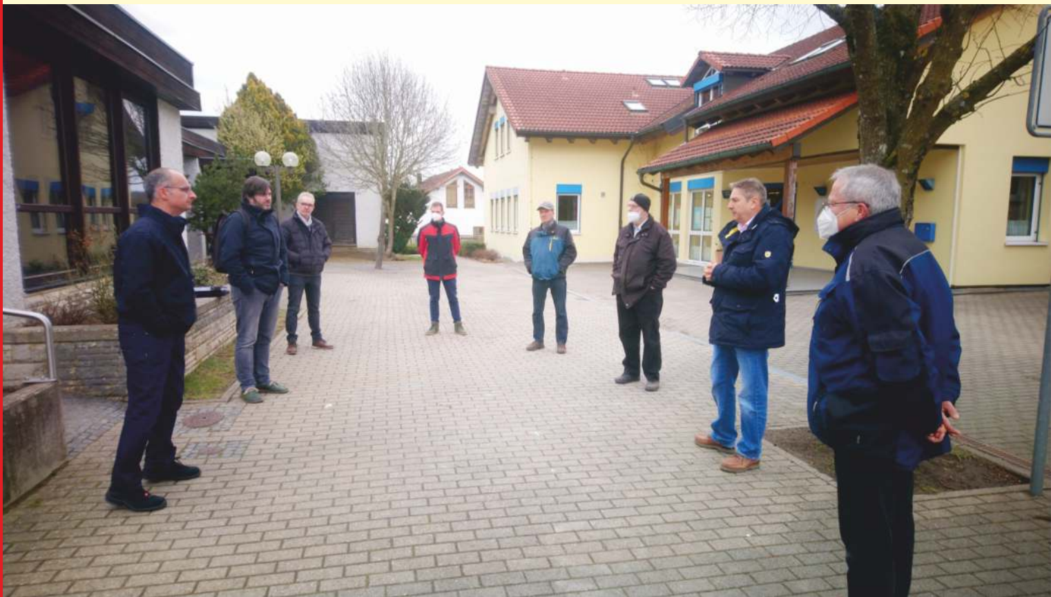
Ortstermin vor wenigen Tagen mit diversen Ingenieurbüros und dem Gemeinderat zur Sanierung der Mehrzweckhalle

Gemeinde Langenaltheim Langenaltheim • Büttelbronn • Rehlingen