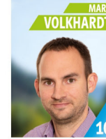
40 Jahre Dipl. Betriebswirt (FH) kfm. Leiter, Prokurist