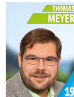
38 Jahre Techniker Maschinenbau 2. Vorstand FFW, 1. Vorstand Theaterschdodl, Mitglied FW Kapelle