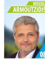
44 Jahre Vertriebsmanager Baufinanzierung Mitglied TTC Büttelbronn, Theaterspieler