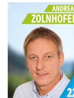
45 Jahre kfm. Angestellter Schriftführer CSU Ortsverband