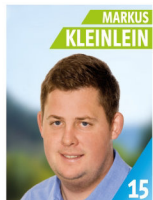
30 Jahre Zimmermeister Mitglied FFW