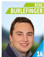
22 Jahre Elektroniker Betriebs techniker Mitglied FFW, FW Kapelle, FESTLA