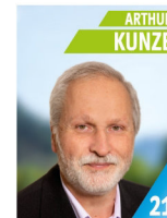
60 Jahre Industriemeister Metall