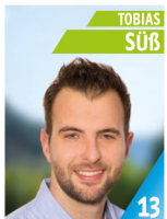
30 Jahre Techniker Mechatronik Mitglied FFW, TVL, FW Kapelle