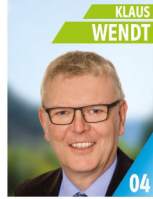
54 Jahre Selbstständiger IT, Techniker Aufsichtsrat Energiegenossenschaft, Mitglied FW Kapelle, Gewerbeverein