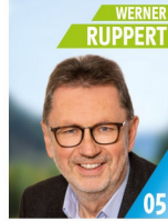
61 Jahre Entwicklungsleiter Gemeinderat, Verbandsrat WZV, Hegeringeleiter, Aufsichtsrat Energiegenossenschaft