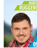
30 Jahre Industriemeister Metall 1. Vorstand FESTLA und Förderverein FFW, Gruppenführer und Ausbilder FFW, Kat. Schutz Lkr WUG