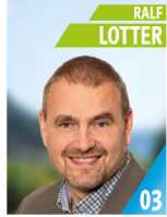
49 Jahre Omnibusunternehmer Gemeinderat, Kassier Gewerbeverein, Mitglied TVL