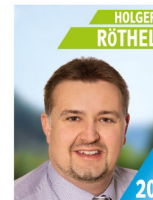
41 Jahre Industriemeister Metall Verbandsrat Hirschberg Grp., Vorstandsmitglied und Jugendwart FFW, Sportleiter Schützen- verein