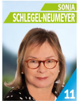
61 Jahre Grundschullehrerin i.R.