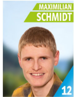
23 Jahre Landschaftsgärtner Mitarbeiter im Bauhof Zeugwart Schützenverein