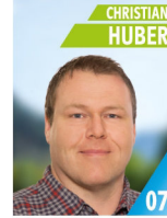
40 Jahre Kfz-Techniker-Meister Gemeinderat, 2. FFW Kommandant, Theaterspieler Theaterschdodl