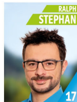
34 Jahre kfm. Angestellter