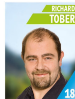
33 Jahre Dipl. Ing. (FH), Agraringenieur Betreiber Nahwärme- netz Büttelbronn