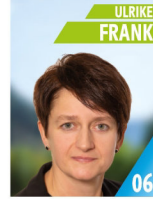
46 Jahre Landwirtin, Spk. Fachwirtin, Hauswirtschaftlerin Ortsbäuerin Rehlingen