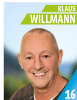
61 Jahre Bäcker, Mitarbeiter im Wertstoffhof