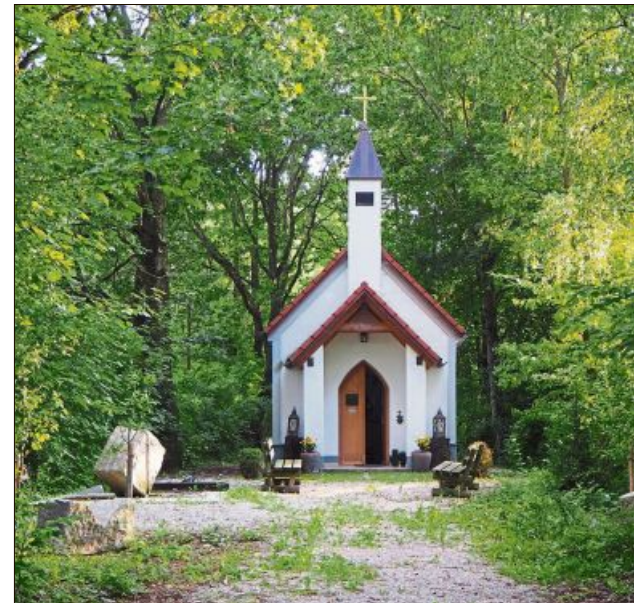
Die Josefs-Kapelle an der ehemaligen Bahnstrecke in Mammning wurde 2013 vom Josefi-Stammtisch erbaut.

hend besiedelt. Davon zeugen die Hügelgräber bei Ottenkofen und Unterweilnbach, die aus der Hallstattzeit um etwa 1000 vor Christi stammen. Erstmals wurde der Name Gottfrieding im Jahre 902 urkundlich erwähnt, das heutige Weilnbach im Jahre 927. Seit 1803 wird Gottfrieding übrigens als Gemeinde im Land Bayern geführt.