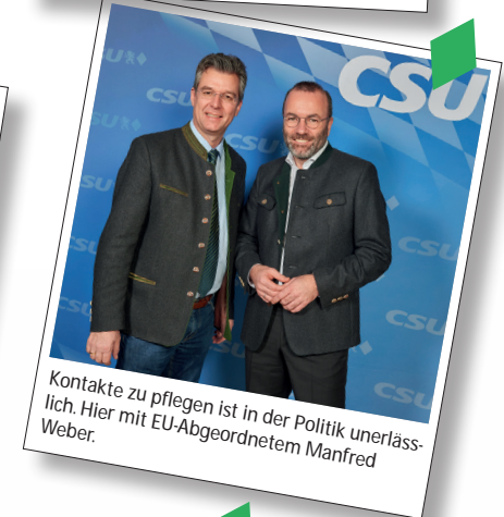
Kontakte zu pflegen ist in der Politik unerlässlich. Hier mit EU-Abgeordnetem Manfred Weber.