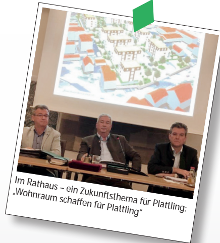
Im Rathaus - ein Zukunftsthema für Plattling: „Wohnraum schaffen für Plattling“