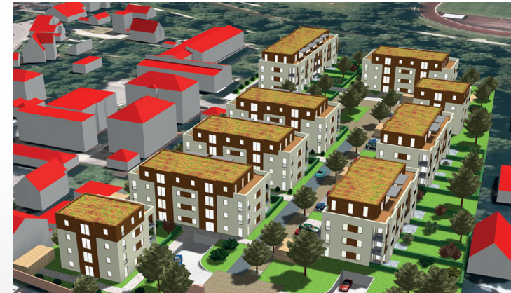
Landauer Straße 41: Hier entstehen ca. 105 Wohnungen durch die Karl-Gruppe – Infos unter: immobilien@karl-gruppe.de

Wohnen für Singles, junge Familien und ältere Bürgerinnen und Bürger. Mitten in Plattling schlummern in den Quartieren Bereiche, die ideal für Wohnbebauung geeignet sind. Innerstädtisches Wohnen ermöglicht es auch älteren Mitbürgern, die nicht mehr so mobil sind, weiterhin am gesellschaftlichen Leben teilzuhaben.