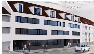
Rathausumbau / Digitalisierung