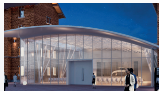
Bürgerhaus mit Multifunktionssaal