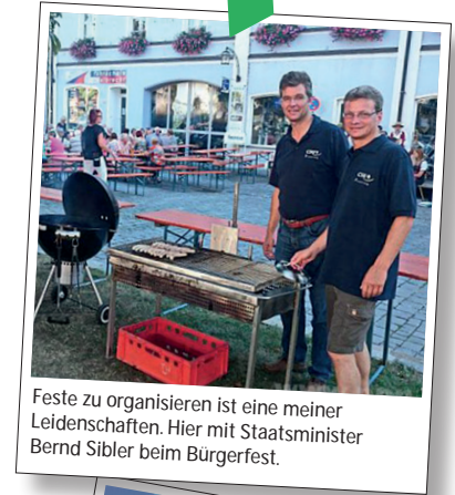
Feste zu organisieren ist eine meiner Leidenschaften. Hier mit Staatsminister Bernd Sibler beim Bürgerfest.