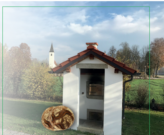
Kochen und Brotbacken im Holzbackofen