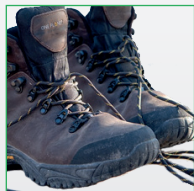
Wandern, Lesen und die Geschichte Plattlings