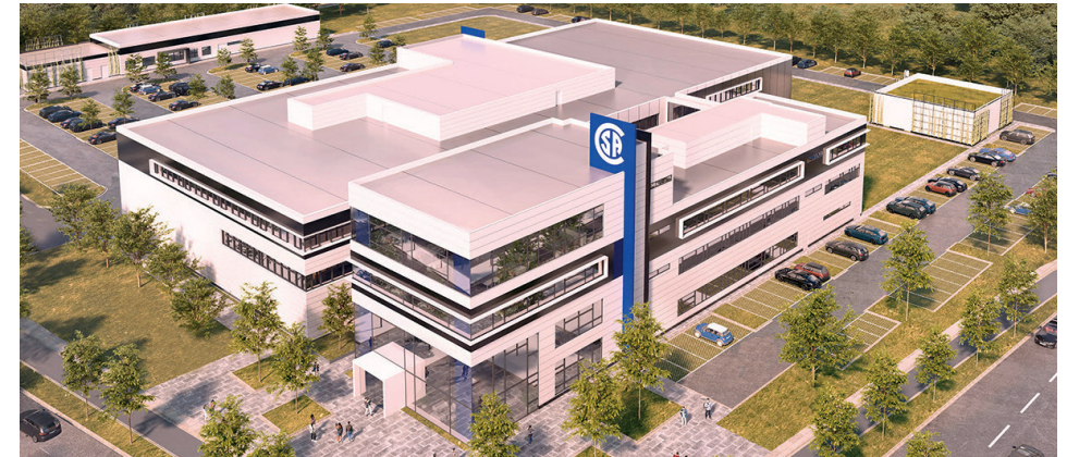
Internationales Prüfinstitut CSA Group GmbH

Die Ansiedlung der CSA als internationales Prüfinstitut zeichnet Plattling als attraktiven Technologiestandort aus. Hier entstehen hochqualifizierte Arbeitsplätze für unsere Plattlinger Bürgerinnen und Bürger. Zur Standortentscheidung trug die Ansiedlung des Technologietransferzentrums MOMO bei.