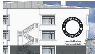
Bildungs- und Betreuungsangebote