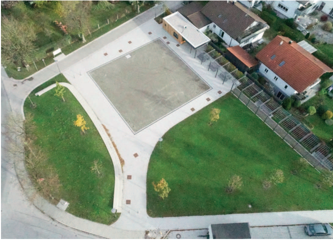
Luftbild vom Dorfplatz in Landsham

Wir haben in den letzten 6 Jahren viel erreicht!