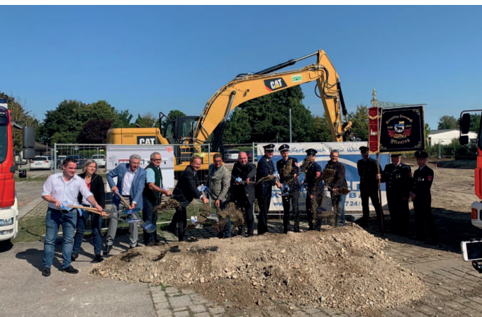
Spatenstich für das neue Feuerwehrhaus Pliening

Die neue Buslinie 262 zur S-Bahn Heimstetten und U-Bahn Riem ist in Betrieb.