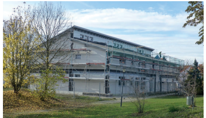
Das Kinderhaus in Landsham entsteht

Bauland für Einheimische wurde in Landsham Süd entwickelt, die Bebauung erfolgt aktuell in nachhaltiger Passivbauweise.