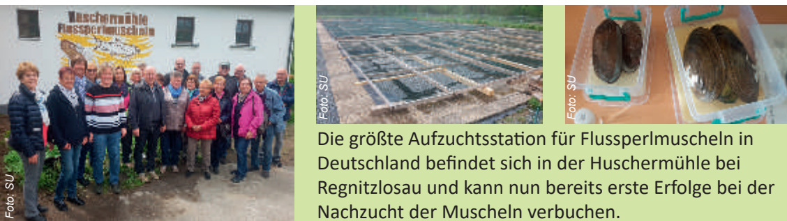
Die größte Aufzuchtstation für Flussperlmuscheln in Deutschland befindet sich in der Huschermühle bei Regnitzlosau und kann nun bereits erste Erfolge bei der Nachzucht der Muscheln verbuchen.