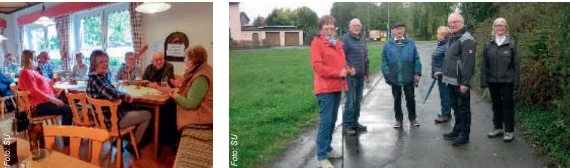
Einige Tapfere machten sich trotz Regenwetter auf, um den Wanderweg Nr. 8 (Steinbruchweg) zu erkunden. Danach freute sich jeder auf den gemütlichen Gasthof Wolfsum in Trogenau.

Frohe und gesegnete Weihnacht, verbunden mit den besten Wünschen für ein gesundes neues Jahr, wünscht die Senioren-Union