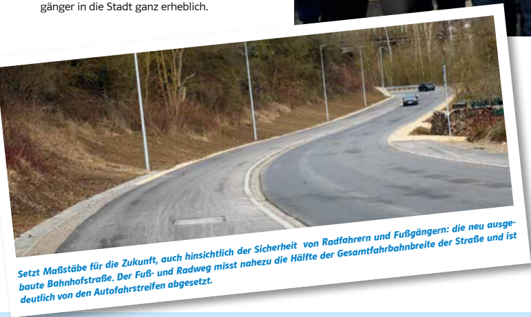
Setzt Maßstäbe für die Zukunft, auch hinsichtlich der Sicherheit von Radfahrern und Fußgängern: die neu ausgebaute Bahnhofstraße. Der Fuß- und Radweg misst nahezu die Hälfte der Gesamtfahrbahnbreite der Straße und ist deutlich von den Autofahrstreifen abgesetzt.

Mit 4,50 m Höhe wird die Fuß- und Radwegbrücke, die auf den bestehenden Pfeilern und Widerlagern der Bahnbrücke aufliegt, etwa halb so hoch wie die aktuelle Eisenbahnbrücke, eine Aussichtskanzel in der Donaumitte inklusive. Die neue Brücke verkürzt die Verbindung zwischen Sinzing und Regensburg vor allem für Zweiradfahrer und natürlich auch die Gehzeit für die Fußgänger in die Stadt ganz erheblich.