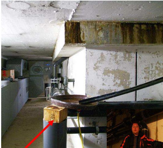
Provisorium zum Auffangen von durch den Beton dringendem Wasser