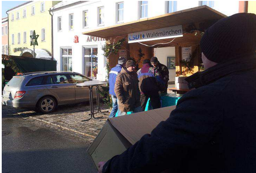
Kräftig angepackt wurde beim Aufbau vom Stand