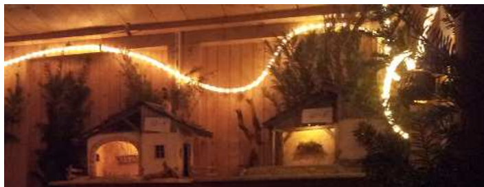
Franz Prifling stellte Krippen zum Kauf

Neu waren Rosswürste, die sich großer Beliebtheit erfreuten und natürlich der alt bekannte und bewährte Pflaumenwein!