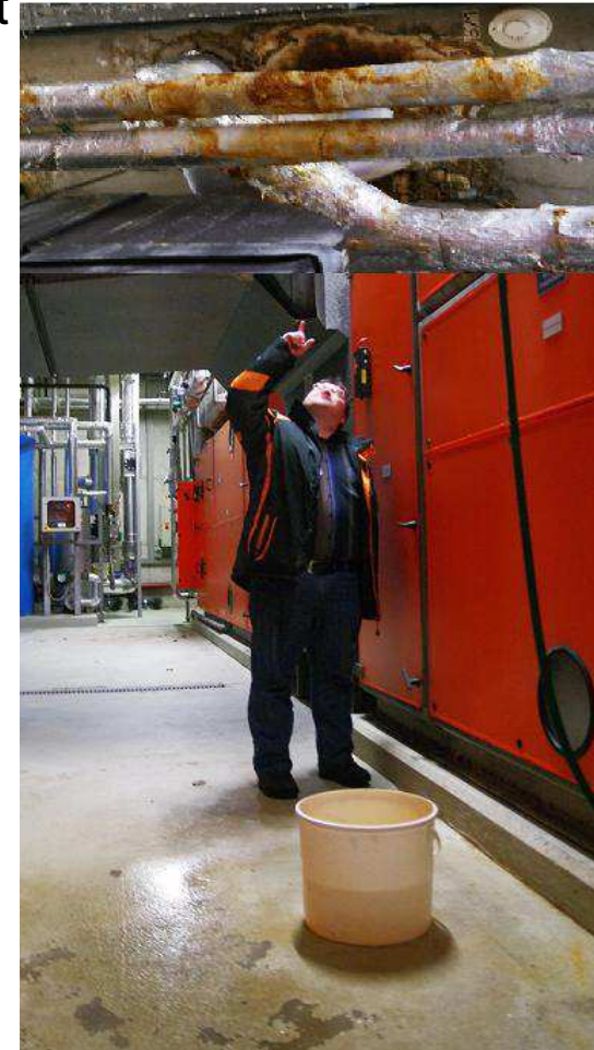
Wasser durchdringt den Beckenboden. Unmittelbar sind Brandmelder und elektr. Einrichtungen gefährdet.