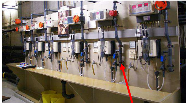
Bei Ausfall weiterer Wasseraufbereitungseinheiten gibt es keinen Ersatz. Die Elektronik muß mit allen Mitteln am Laufen gehalten werden!