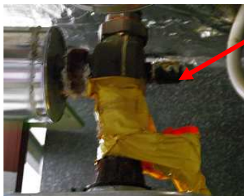
Lüftungsregelung für Freizeithalle muß analog betätigt werden. Die elektronische Regelung kann nicht mehr instandgesetzt werden.