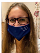
CSU- Fraktion Wartenberg