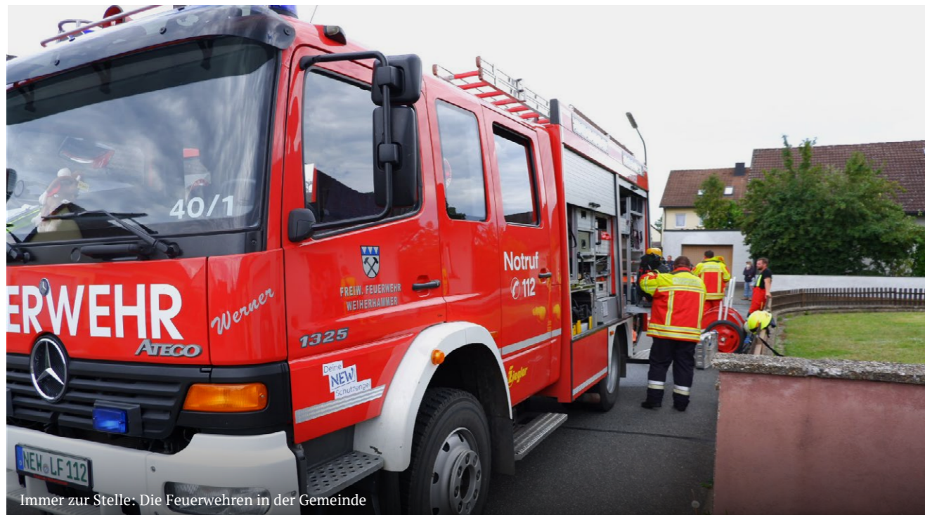
Immer zur Stelle: Die Feuerwehren in der Gemeinde

Dann haben wir noch eine besondere Entwicklung erlebt: In Zeiten, in denen ehrenamtliches Engagement tendenziell leider zurückgeht, gründet sich eine „Nachbarschaftshilfe“ mit vielen Helferinnen und Helfern im Rahmen von ALIA. Das ist ein tolles Zeichen für unsere Gemeinde. In Summe kann man zusammenfassen: Die Gemeinde hält zusammen! Allen gilt großer Dank für ihren Einsatz im Jahr 2020. Es kommen wieder andere Zeiten und darauf können wir uns schon alle freuen.