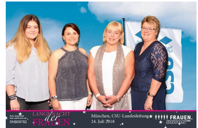
München, CSU-Landesleitung 24. Juli 2018