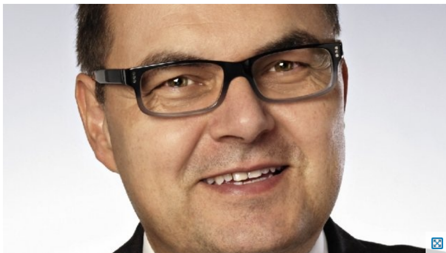
Bundesminister Christian Schmidt, MdB

Bundesminister Schmidt im Interview mit dem Bayernkurier zum Thema Ukraine: