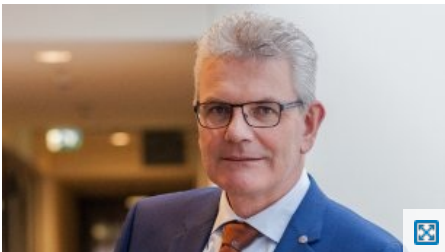
Artur Auerhammer, MdB